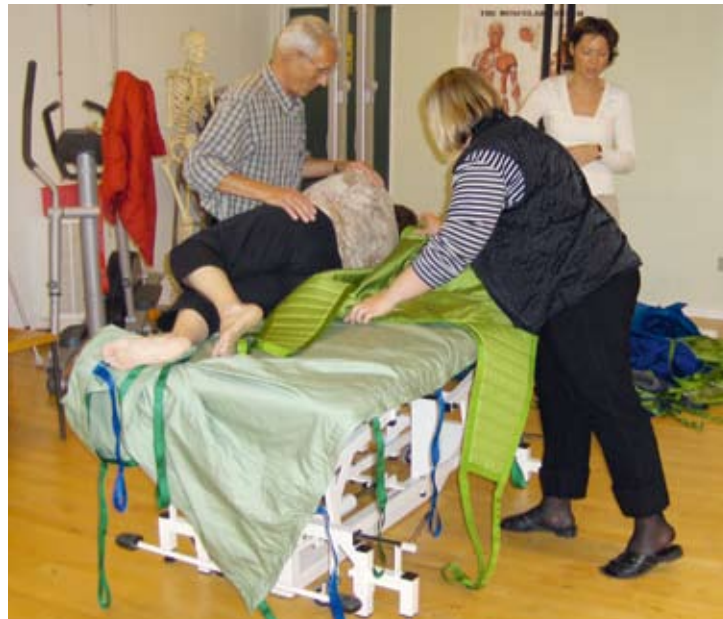
Placering af løftesejl