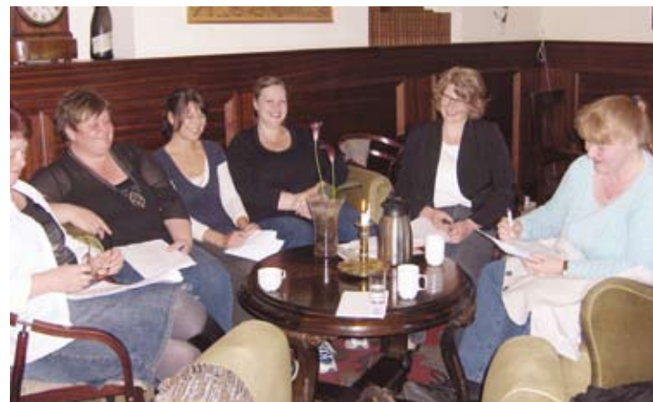
Personale fra Terapiafdelingen i aktion. Kedeligt var det ikke!