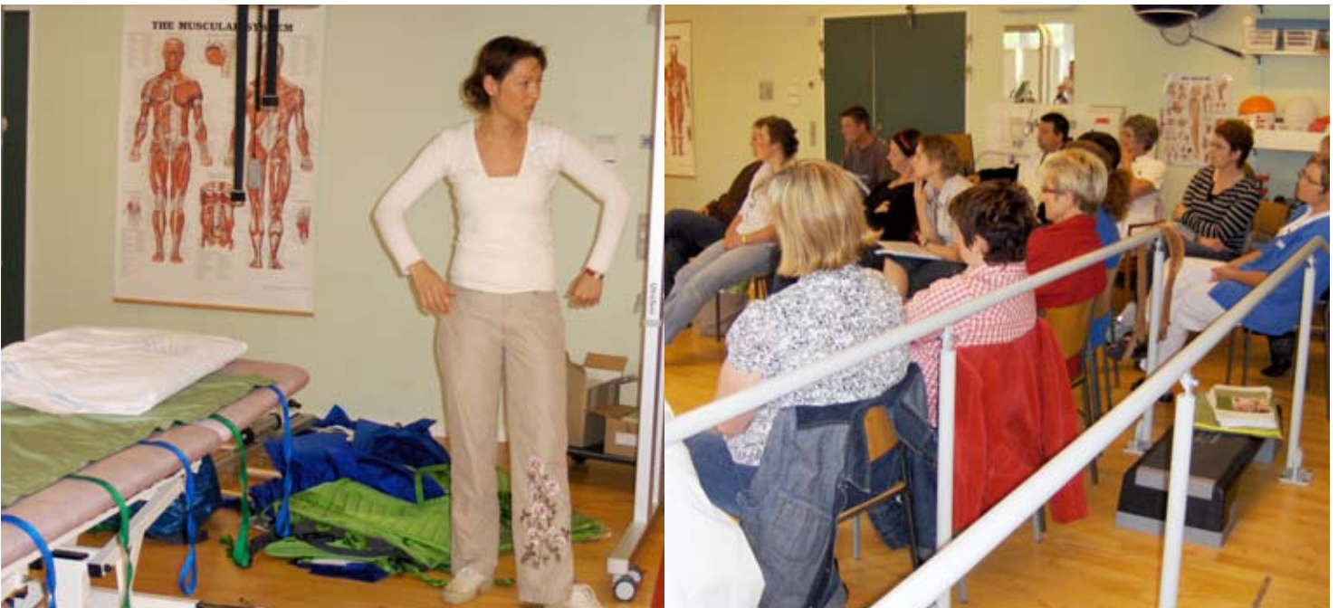
En inspirerende dag om brug af liftudstyr er i fuld gang