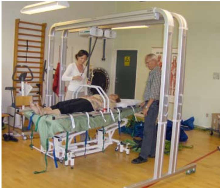
Demonstration i brugen af lift