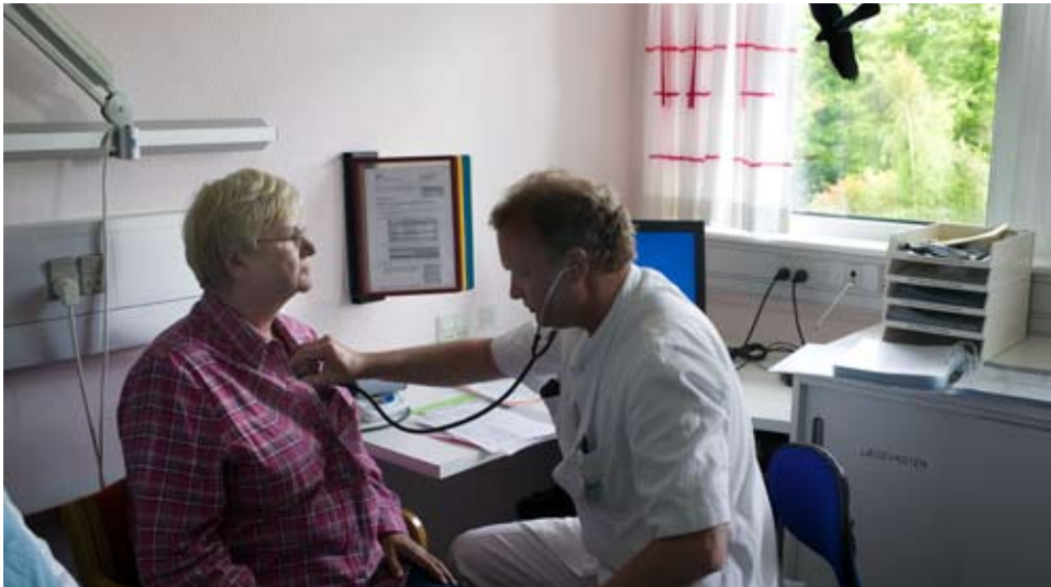
Ortopædkirurgisk Klinik i Farsø har haft stor succes med at arbejde ekstra uden for normal arbejdstid.

Der er smil hele vejen rundt. Patienter, personale og region er tilfredse med friklinikkemodellen, som den bl.a. bruges af Ortopædkirurgien i Farsø: Ventelisten skrumper, personalet får mulighed for ekstra indtjening – og modellen er langt billigere end alternativet, som er at sende patienterne til operation uden for regionen.