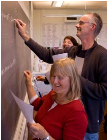
De tyske sygeplejersker har travlt med at lære danske verber på Kursuscenter Vest i Esbjerg.