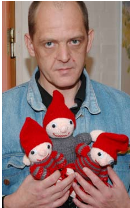
En af beboerne er nisse-entusiast. Her bliver årets første hjemmeproducerede nisser vist frem.

Kærvangs beboere holder jul hjemme ved familien, og når de er taget afsted, starter juleaften på Kærvang med pyntning af jule-