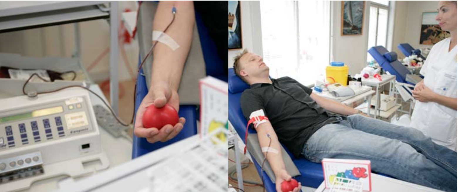
Lidt betænkelig var jeg jo. Men sygeplejerskerne i Blodbanken er enormt søde, og selve tapningen mærkede jeg stort set ikke.

så de kan finde ud, om man er egnet som donor.