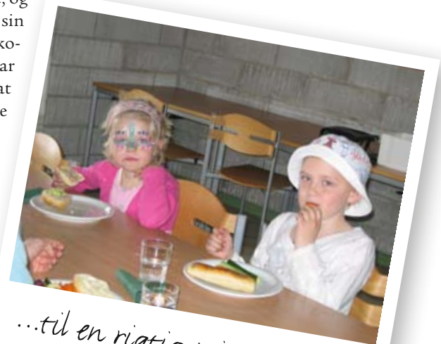
...til en rigtig prinsessefrokost.

de er meget hjemme sammen med mor eller far, da de ikke kan komme i børnehave. De ældre børn får en masse ud af at møde andre i samme situation – nogen som også forstår dem følelsesmæssigt.