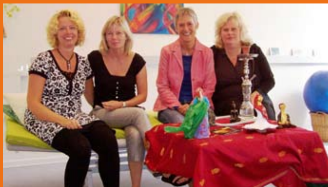
Mangfoldighed og farvestrålende indtryk præger Rehabiliteringscenter for Flygtninge.

Redaktionen er på jagt efter Specialsektorens sjæl ud fra den vinkel, at sjælen ofte viser sig i det sociale liv i en organisation / institution. I sidste nummer var vi på besøg i vaskeriet på Sødibakke. Redaktionen har valgt Rehabiliteringscentret for Flygtninge som 3. station i jagten på sjælen.