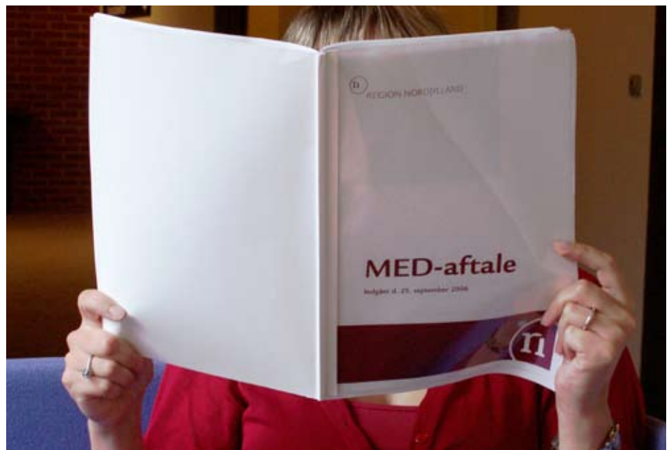
MED-aftalen skal læses grundigt igennem inden evalueringen starter.