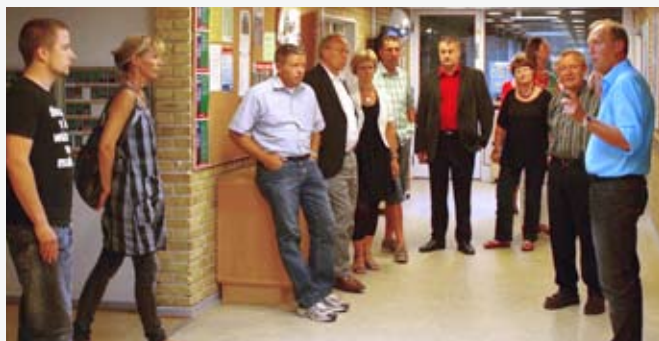
Der var stor sporgelyst ved rundvisningen af kandidaterne på Aalborgskolen