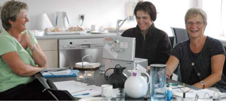
Projektets konkrete værktøjer har været til stor hjælp for personalet på Strandgården, når det står med de svære etiske spørgsmål.

og værdighed over for et ønske om beskyttelse og omsorg.