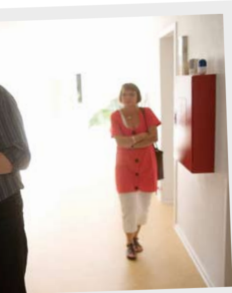
g Bach gennemgår velkomsttalen til politikerne en