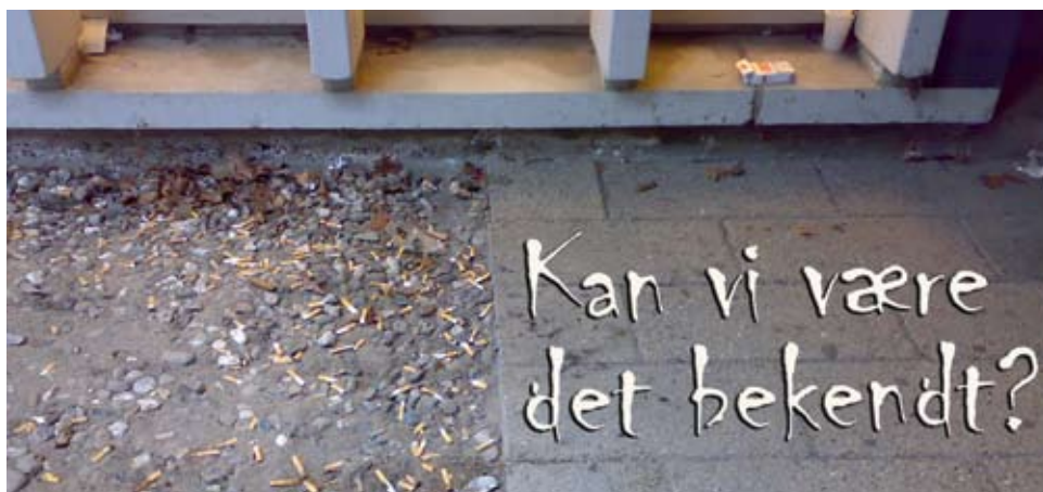
Billede taget ved trappeskakt bag Afsnit Syd.