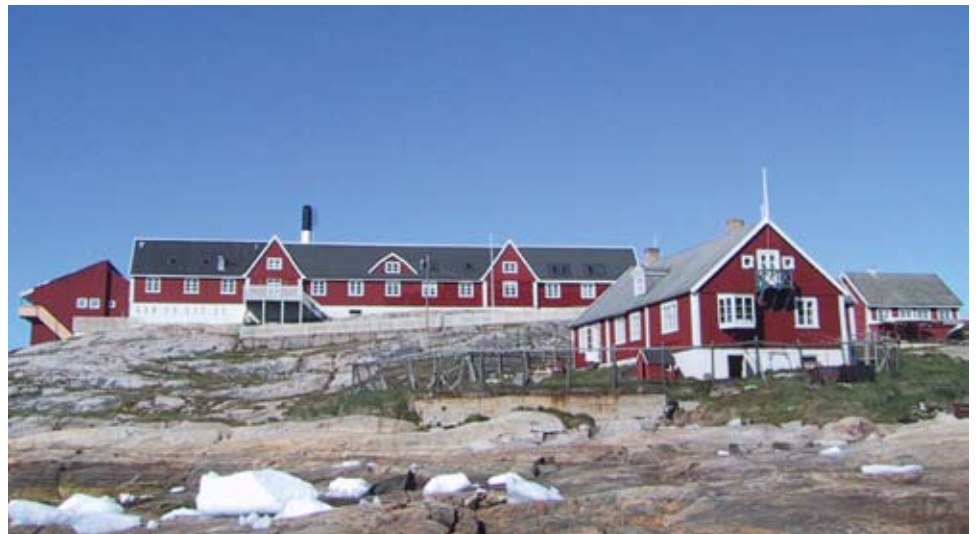
Sygehuset i Ilulissat. Forrest ligger cheflægens bolig.